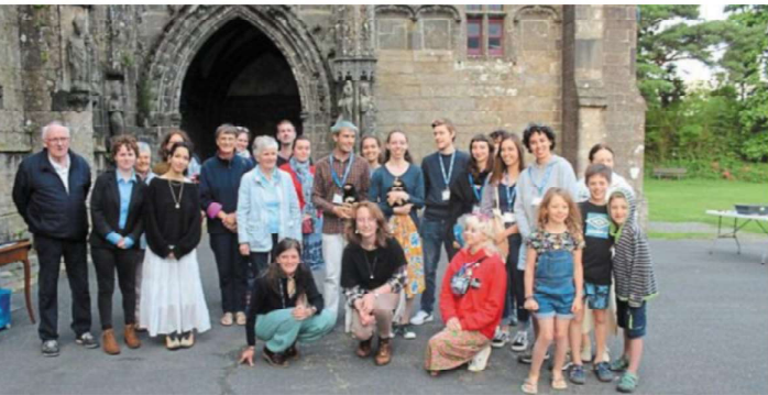
Le groupe et les guides de la Sprey à l'issue de la soirée.

Une soirée du patrimoine religieux réussie