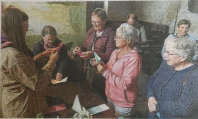
Après la conférence, un atelier origami pour fabriquer son ex-voto était proposé. Un ex-voto pour rappeler le soleil d'été peut-être ?