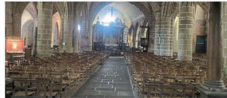
L'église Saint-Guérolé regorge de trésors architecturaux.