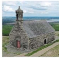
La chapelle du mont Saint-Michel de Brasparts.