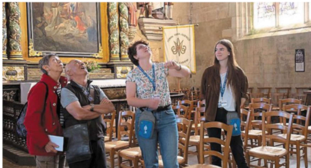
Les guides de l'association de Sauvegarde du patrimoine religieux en vie accueillent le public, à l'enclos paroissial, jusqu'à dimanche.