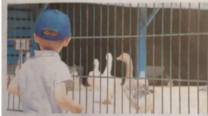
La ferme de la Ville-Oger, à Saint-Brieuc, se découvre ce lundi.

Viste d'une ferme, d'une cathédrale... Voici une sélection d'idées de sortie pour ce lundi, dans le pays de Saint-Brieuc.