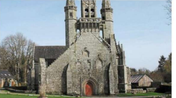
La chapelle Saint-Fiacre a été classée Monument historique en 1989.

Aujourd'hui , soirée du patrimoine : Entrée libre et offerte. Rallye photo de 18 h 30 à 20 h 30, dans la chapelle. Éclairage et présentation du jubé, de 21 h à 21 h 45 (une crêpe offerte).