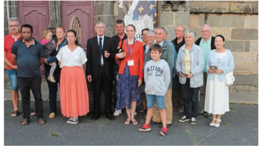
La photo souvenir a réuni tous les participants autour des guides et de Sherlock Holmes...